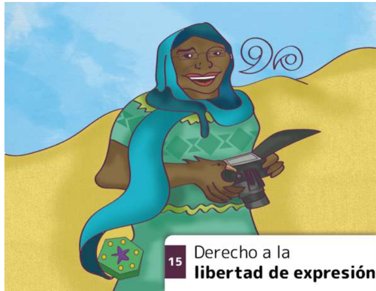
15 Derecho a la libertad de expresión