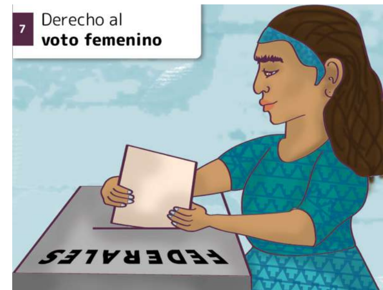
7 Derecho al voto femenino