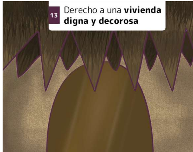
13 Derecho a una vivienda digna y decorosa