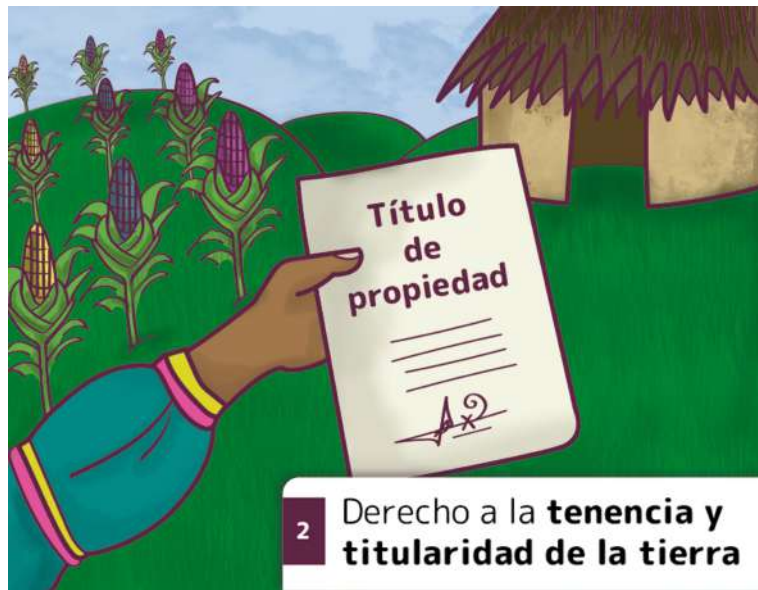
2 Derecho a la tenencia y titularidad de la tierra