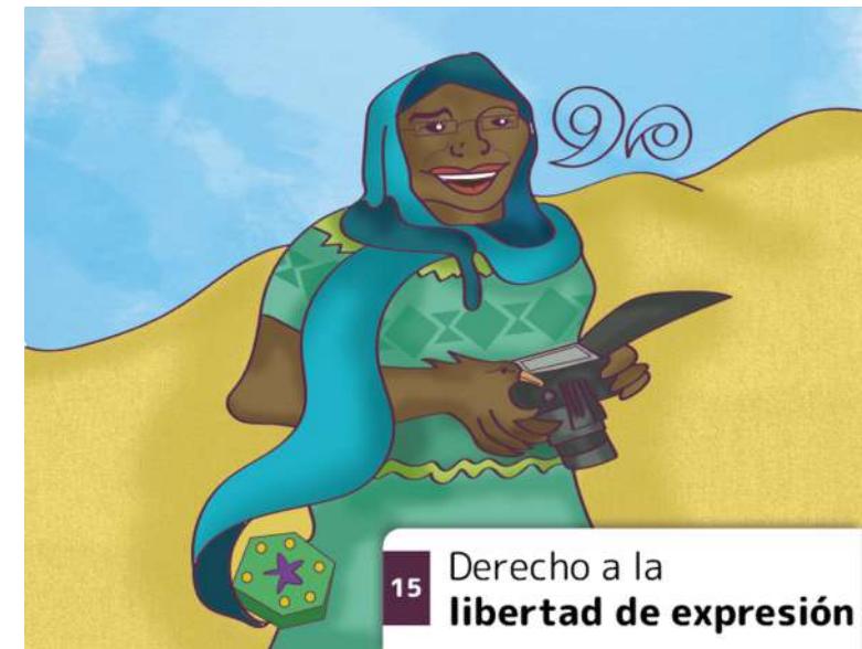
15 Derecho a la libertad de expresión