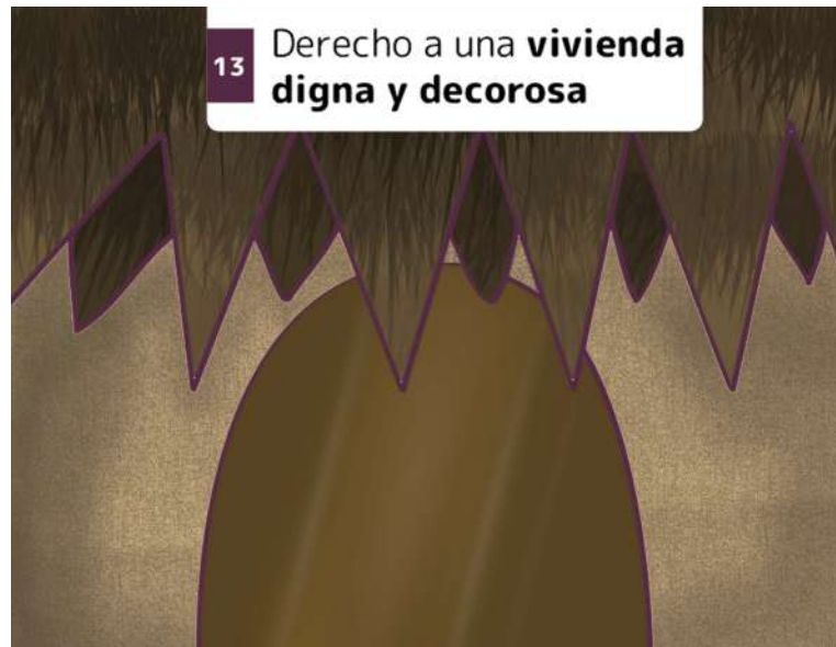
13 Derecho a una vivienda digna y decorosa