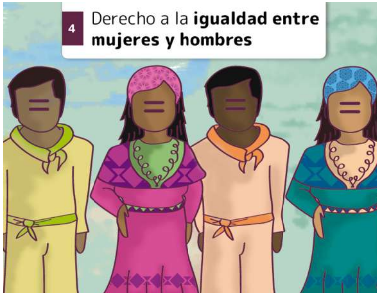
4 Derecho a la igualdad entre mujeres y hombres