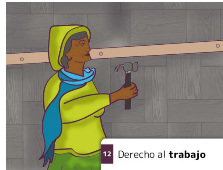
12 Derecho al trabajo