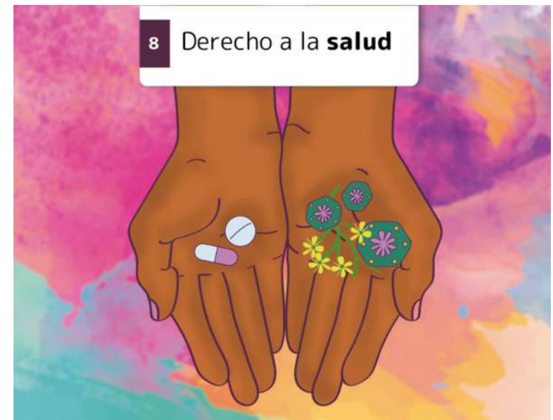
8 Derecho a la salud