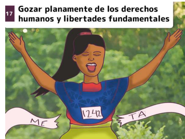
17 Gozar plenamente de los derechos humanos y libertades fundamentales