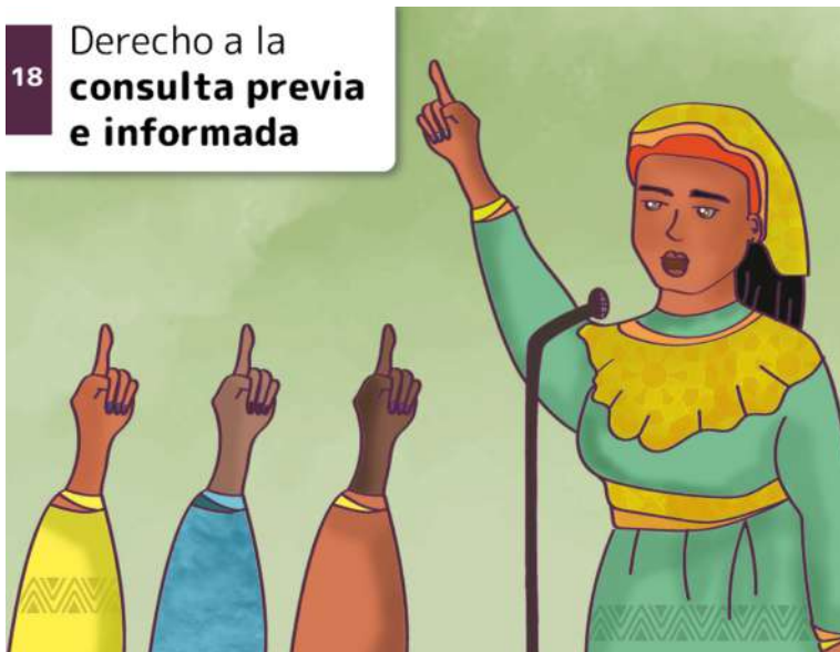
18 Derecho a la consulta previa e informada