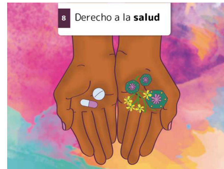
8 Derecho a la salud