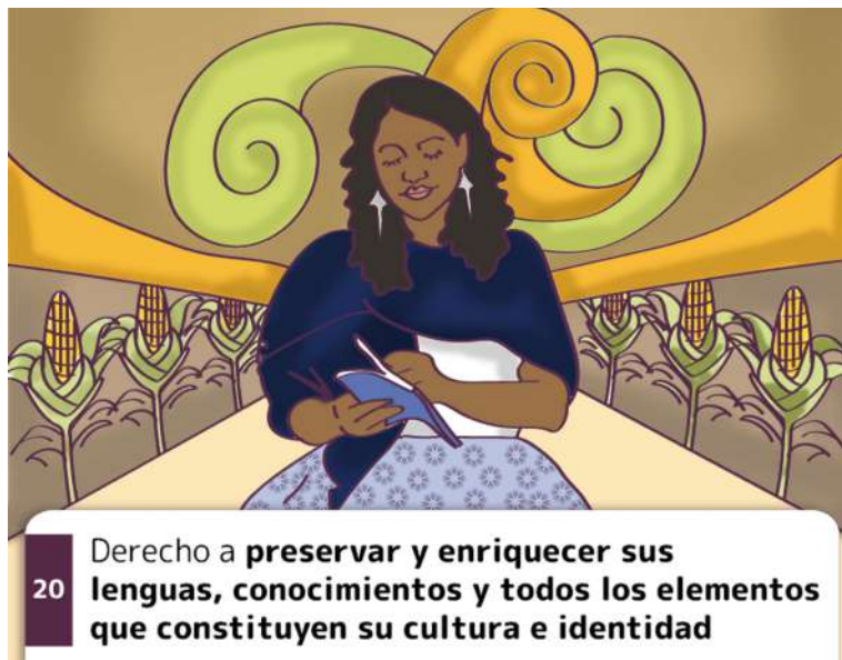
20 Derecho a preservar y enriquecer sus lenguas, conocimientos y todos los elementos que constituyen su cultura e identidad