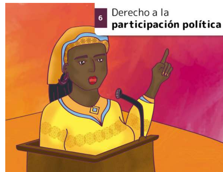
6 Derecho a la participación política