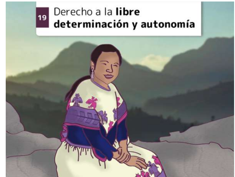
19 Derecho a la libre determinación y autonomía