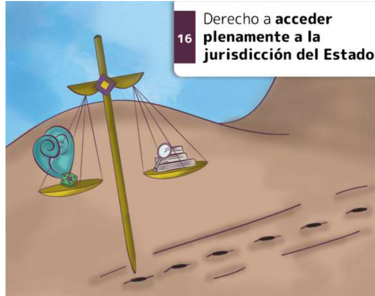
16 Derecho a acceder plenamente a la jurisdicción del Estado