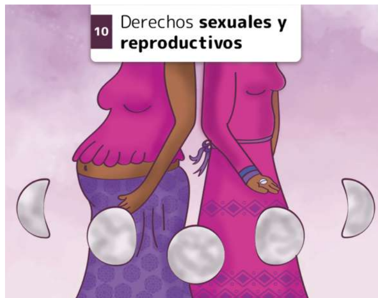
10 Derechos sexuales y reproductivos