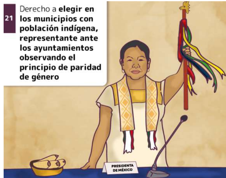
21 Derecho a elegir en los municipios con población indígena, representante ante los ayuntamientos observando el principio de paridad de género