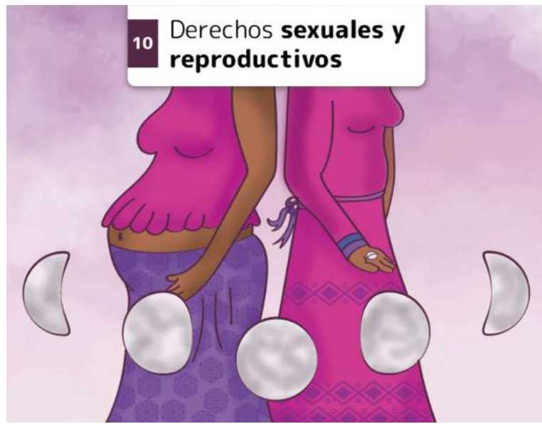
10 Derechos sexuales y reproductivos