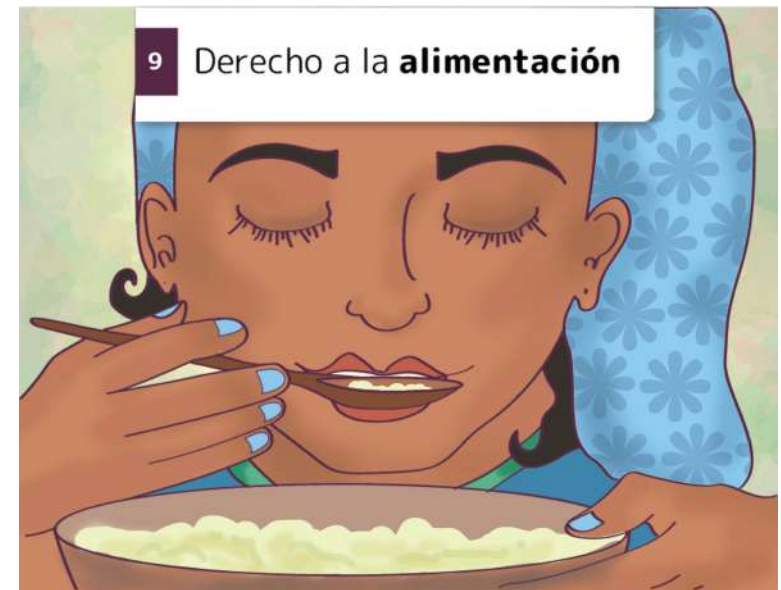
9 Derecho a la alimentación