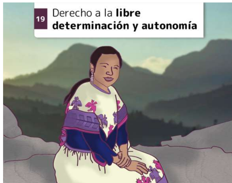
19 Derecho a la libre determinación y autonomía