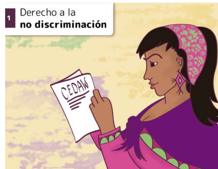
1 Derecho a la no discriminación