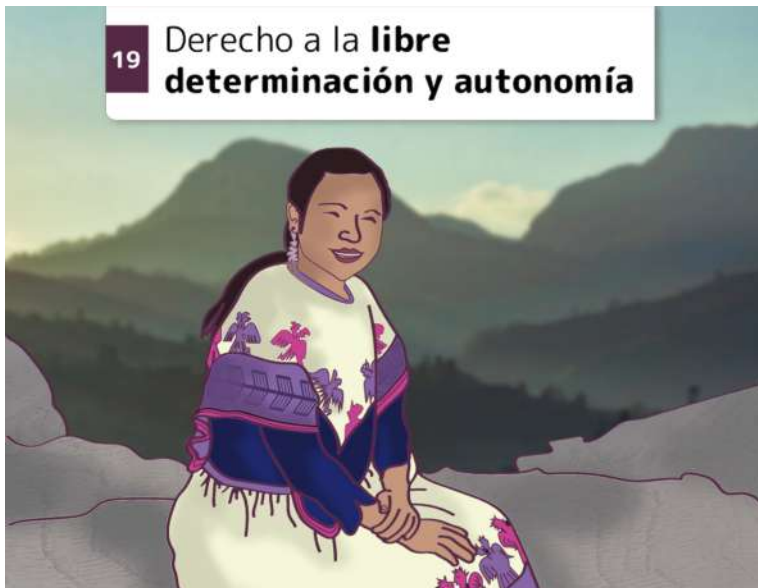
19 Derecho a la libre determinación y autonomía