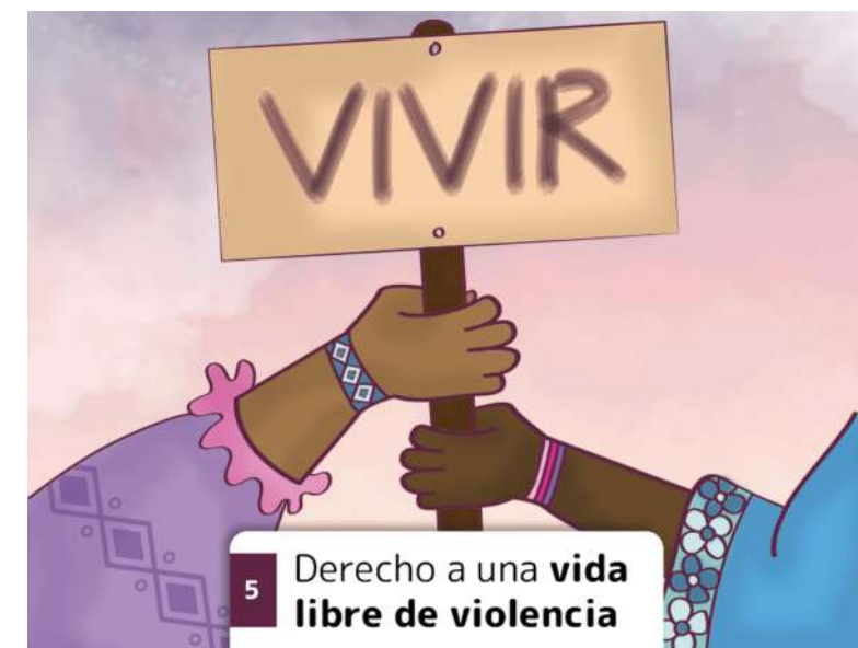
5 Derecho a una vida libre de violencia